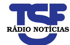
TABELA 2019 de publicidade